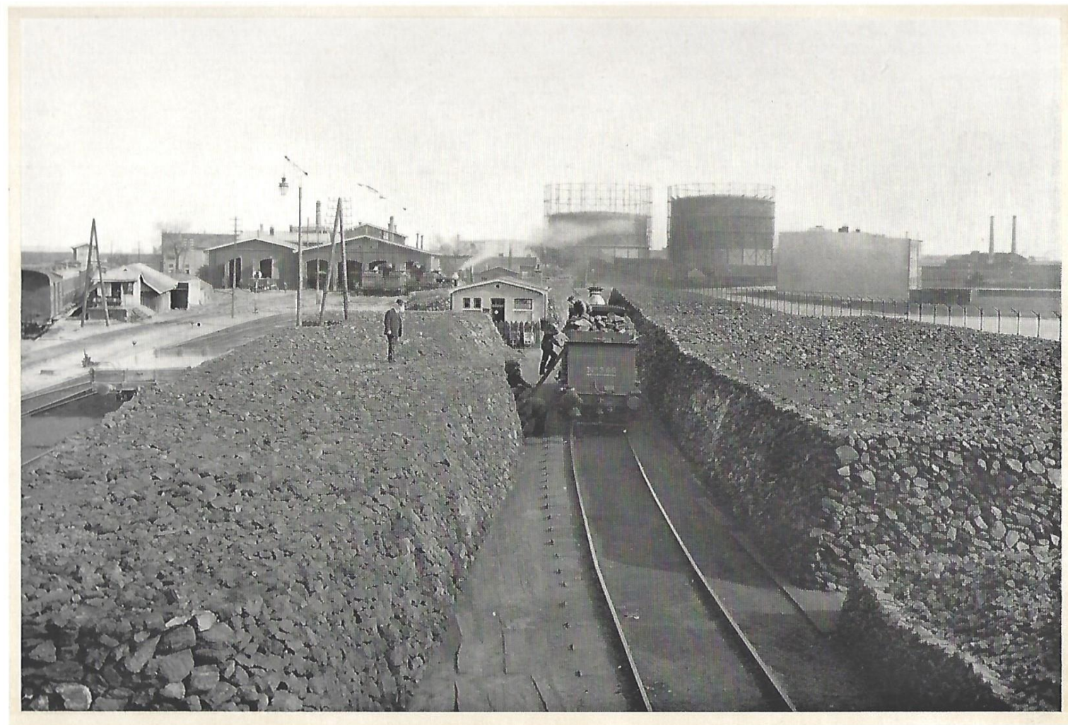
KOLENDEPÔT OP HET STATION 'S-GRAVENHAGE.