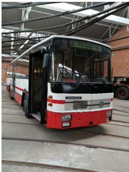
14 maart. Aankomst "thuis"

Of dat nog niet genoeg was is er nog een belangrijke gast binnen komen rijden: de ex-MIVA 1001 Mercedes/Jonckheere in zijn oorspronkelijke wit-rode uniform. Het is voor vele Antwerpenaren een iconische bus geweest. Er was wel wat archiefwerk nodig om het toch wel speciale kleurenplan aan het carrosseriebedrijf door te spelen. Het nummer en het MIVA-logo moesten er nog op en we hebben de zwart-fluo 'bezuinigingsfilm' al vervangen door originele gekleurde lijnfilm.