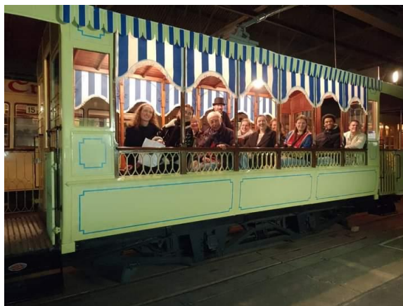
De laatste Ghostwalk winterseizoen in de glimmende 216

Dat wensen we ook voor de 328 en bijwagen 55. Onze technische ploeg Paul VK, Frank en Erik heeft ze op de put gezet en grondig nagezien waarbij ze een totaal verwrongen trekstang van de 55 in een smidse moesten laten behandelen alsook de oliewieken van de aspotten moesten vernieuwen. Dat moet wel aangezien ze gaan rijden tijdens 150 jaar tram in Gent.