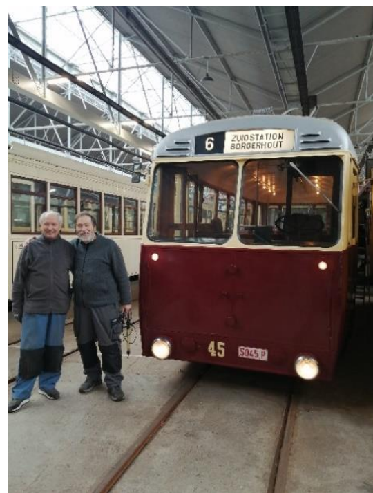
“welle zijn de manne die de lamp doen branne”