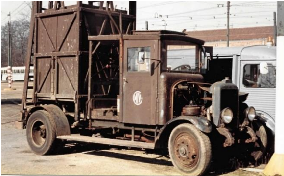
Voorjaar 1973 !

De sfeer was al helemaal historisch toen de antieke ETG ladderwagen kwam binnenrijden. Met zijn benzinemotor maakte die nauwelijks lawaai en nog minder dieselstank. In de technische hoek hebben Lieven, Luc en nog wat vaste jongens de laddertoren erop gezet omdat daar genoeg open ruimte en geen bovenleiding is. Er kwam op een morgen een zware, hypermoderne truck met kraan aan te pas. De Pipe-Bovy zou zo een rol kunnen spelen in een slapstick film en dat maakt hem juist zo mooi. Hij zal -helemaal op eigen kracht- de reis van zijn leven naar Gent en terug maken, stel u voor.