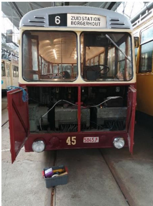
Met zijn muil open

Erik en Roland hebben de verlichting van de trolleybus en motorwagen 484 aangesloten op de veiligere 220V zodat de lampjes weer de knusse sfeer van vroeger oproepen.