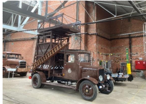
Voorjaar 2024 !

En het filmpje: 2024-02-22 februari 2024 kraanwerken opbouw Pipe ladderwagen .mp4