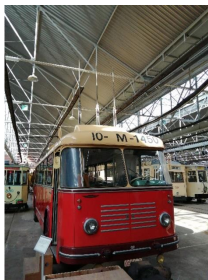
Nu is het geen gewone bus meer!

De gyrobus is weer helemaal gyrobus! Roger en Bruno hebben de stroomafnemers naar boven gekregen met perslucht uit hun compressor en hebben dan op een onzichtbare manier een balk tegen de scharnierpunten geplaatst.